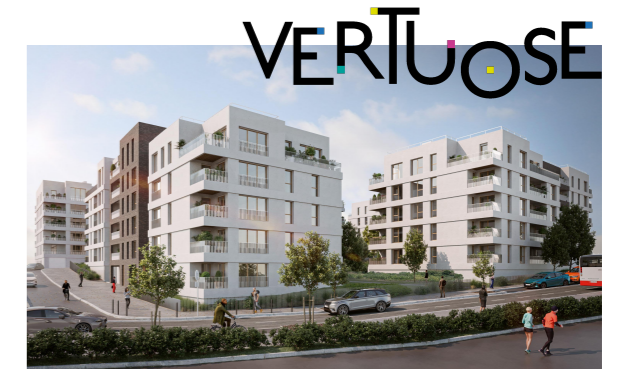
ARCHE GUEDON 77 200 TORCY